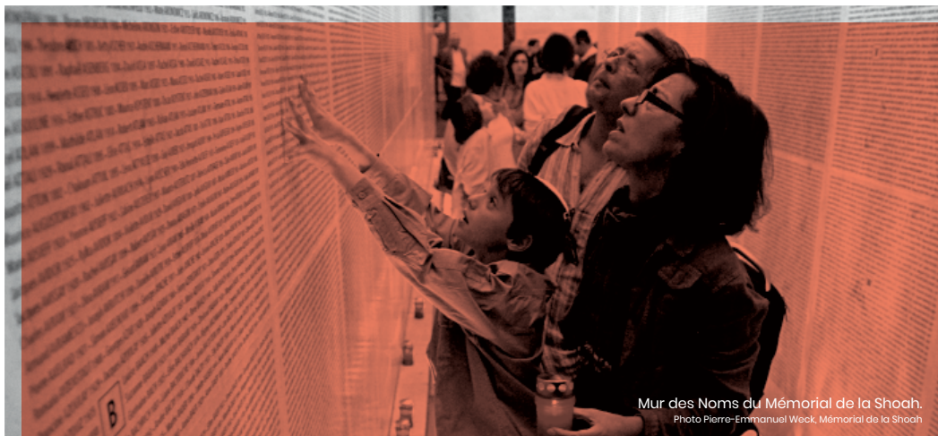
Mur des Noms du Mémorial de la Shoah.