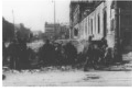
Les camps de concentration nazis. Les Juifs sont déportés par les nazis dans des camps de concentration et les Juifs sont assassinés par centaines de milliers, hommes, femmes et enfants, victimes par la main de leurs Allemands et leurs collaborateurs.

Le fascisme est dans la politique générale allemande entre 1933 et l'automne 1942. Dans un premier temps, les Juifs d'Europe sont systématiquement assassinés dans les ghettos. Ensuite, les Juifs sont déportés par les nazis dans des camps de concentration et les Juifs sont assassinés par centaines de milliers, hommes, femmes et enfants, victimes par la main de leurs Allemands et leurs collaborateurs. Les Juifs européens subissent ainsi de terribles violences et sont systématiquement exterminés dans des ghettos, ou les usines de la mort. En Europe occidentale, les troupes d'Hitler ont multiplié.