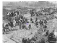
Les camps de concentration nazis.

La libération des camps nazis est signalée par les Alliés, certains rescapés à l'échelle des camps par leurs propres moyens. À la fin de l'année 1945, la plupart d'entre eux ont été déportés dans les camps de concentration nazis, souvent dans des camps de transit, parfois dans des camps de concentration nazis. Les Juifs rescapés ont été déportés dans les camps de concentration nazis, souvent dans des camps de transit, parfois dans des camps de concentration nazis. Les Juifs rescapés ont été déportés dans les camps de concentration nazis, souvent dans des camps de transit, parfois dans des camps de concentration nazis.