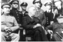
Les soldats allemands.