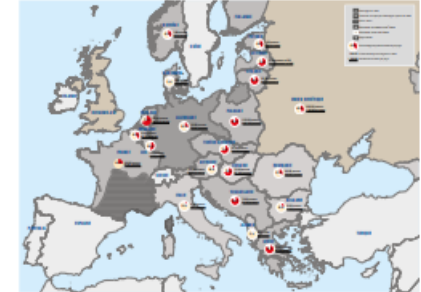
LE BILAN DE LA SHOAH EN EUROPE

Par recoupement des données démographiques, on sait aujourd'hui que le bilan de la destruction des Juifs d'Europe oscille entre 5,9 millions et 6,2 millions de victimes : ces chiffres représentent plus de 60 % des Juifs d'Europe, plus du tiers des Juifs du monde.